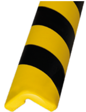
Paracolpi Safe In®, Ø 40 x 780 mm lunghezza, colore giallo/nero