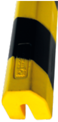
Paracolpi Safe In®, 36 x 37 x 780 mm lunghezza, colore giallo/nero