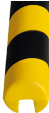
Paracolpi Safe In®, Ø 40 x 780 mm lunghezza, colore giallo/nero