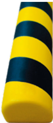
Paracolpi Safe In®, 35 x 780 mm lunghezza, colore giallo/nero