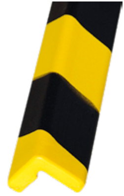
Paracolpi Safe In®, 27 x 27 x 780 mm lunghezza, colore giallo/nero