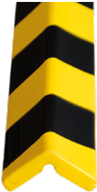
Paracolpi Safe In®, 45 x 45 x 780 mm lunghezza, colore giallo/nero