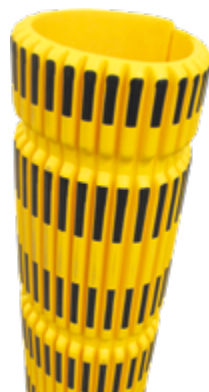
Paracolpi Safe In® cavo, altezza 780 mm, spessore 20 mm, rigato colore giallo/nero