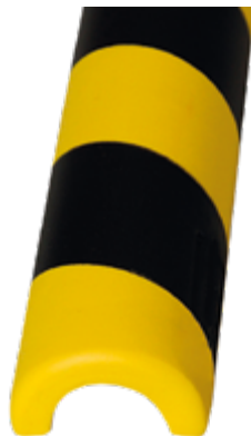
Paracolpi Safe In®, 50 x 780 mm lunghezza (Ø interno 30 mm), colore giallo/nero