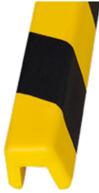
Paracolpi Safe In®, 32 x 28 x 780 mm lunghezza, colore giallo/nero