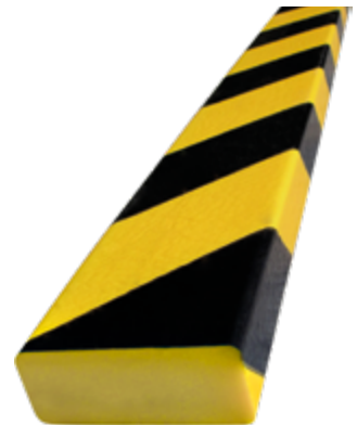
Paracolpi Safe In®, 20 x 50 x 780 mm lunghezza, colore giallo/nero